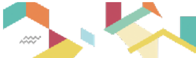
Mars 2017 (26*4 ! + 14 / 3! + 12 BGE/15)